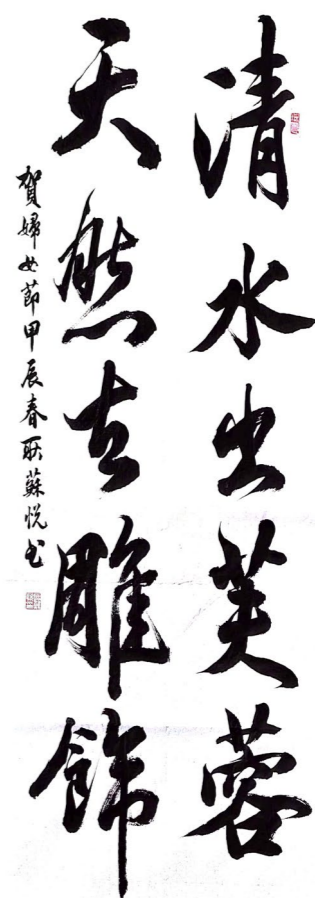
书法：《如在野，温柔热烈》